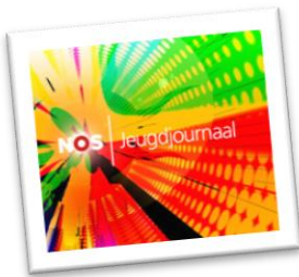
NOS Jeugdjournaal www.jeugdjournaal.nl

Hét dagelijkse nieuwsprogramma voor kinderen van negen tot en met twaalf jaar. Het Jeugdjournaal brengt je op de hoogte van belangrijk binnen- en buitenlands nieuws en wil je hierover laten meedenken en meepraten. Er worden belangrijke thema's uitgelegd, maar ook komen er kleinere leuke en/of grappige berichten voorbij.