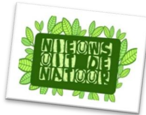
Nieuws uit de Natuur www.nieuwsuitdenatuur.nl

Hét dagelijkse nieuwsprogramma voor kinderen van negen tot en met twaalf jaar. Het Jeugdjournaal brengt je op de hoogte van belangrijk binnen- en buitenlands nieuws en wil je hierover laten meedenken en meepraten. Er worden belangrijke thema's uitgelegd, maar ook komen er kleinere leuke en/of grappige berichten voorbij.