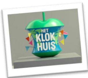
Het Klokhuis www.hetklokhuis.nl

Nieuws uit de Natuur is een programma voor groep 5/6 van de basisschool. Verschillende thema's rond het kerndoel (van de overheid) "Oriëntatie op jezelf en de wereld" worden in dit programma behandeld. Hierbij valt te denken aan bijvoorbeeld techniek, milieu en gezond- en redzaam gedrag. Verder brengt het team van Nieuws uit de natuur de doelgroep op de hoogte van actuele gebeurtenissen binnen het vakgebied om betrokkenheid bij hun eigen leefomgeving te verhogen.